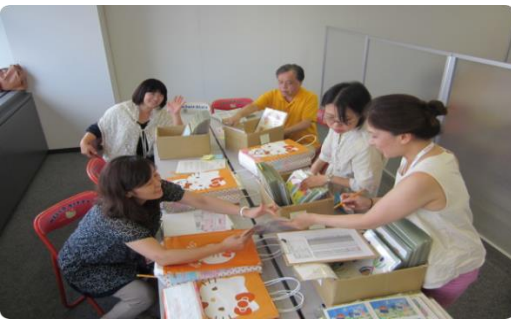
←準備を行うお手伝い隊のみなさん

私がインターンシップとして参加した8月5日には大崎の事務局や小田急百貨店町田店で8月19日には同じく大崎事務局にて「花と笑顔」こども絵画コンクールの準備が行われました。その際には多くのボランティア(通称お手伝い隊)のみなさんも協力してくれました。Facebookやメーリングリストなどを通じて毎回集められるお手伝い隊の皆さんは職業や年齢は違えど、それだけハロードリーム実行委員会の活動に賛同してくださっている証だと感じる瞬間でもありました。また、そういったさまざまな方面からやってくるお手伝い隊のみなさんをまとめる事務局の方々の姿も輝かしく見えました。