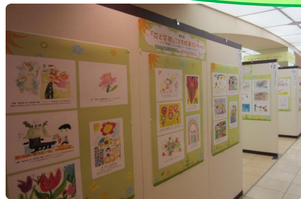
↑小田急百貨店にて作品の貼り付け作業も手伝わせて頂きました！