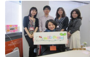
↑事務局のみなさんと一緒に。

■ハロードリーム実行委員会とは■ 皆さんは夢ってありますか？子どもの時に夢を一度も描いた経験がない人はいないと思います。子どもの描く夢は大小さまざま想像力にあふれているに違いありません。私の子どもの頃に描いた夢を思い出してみると、アニメのキャラクターになりたいというような事も言っていました。純粋な頭で描いた夢はたとえ現実的な物でなくてもそれはかけがえない物になるでしょう。こういった「こども夢をはぐくむ社会になる」ことを目指して立ち上がったのがハロードリーム実行委員会です。「夢」を通してこどもと大人さらには世界全体までもつなげる「かけはし」となるようセミナーやイベントを開催しているNPO法人です。北は北海道から南は沖縄まで開催実績は大きさは全国規模！2012年には全ての都道府県でハロードリーム主催のセミナー・イベント開催が実現したそうです。この事からもハロードリームの輪は確実に広がっている証拠ではないでしょうか？あなたの住む県でも開催しているかもしれませんよ！子どもたちは夢を描くということ、大人たちはその姿を見て笑顔にまた夢を見つめなおしてみたり、夢の再発見をハロードリーム実行委員会を通じて行ってみてください。きっとかけがえのない物となるに違いありません。